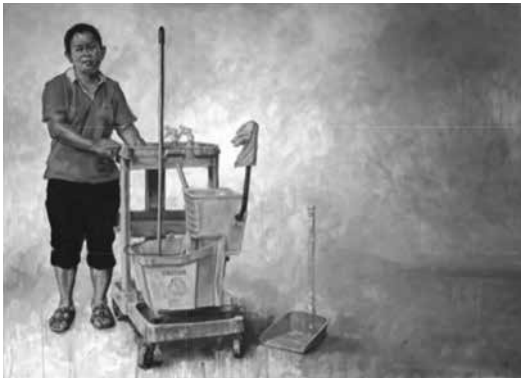
ภาพประกอบ 10 : ผลงานชิ้นที่ 10

ที่สด ใหม่ ตามพื้นที่ที่ทำได้ เช่นยอดผัก มะละกอ มะม่วง หอยขม เป็นต้น และการพกระดืบข้าวเหนียวติดตัวตลอดเวลา ไม่จำเป็นต้องหาซื้อจากที่ไหน เป็นวัฒนธรรมติดตัวมาแต่อดีต จนถึงปัจจุบันสิ่งเหล่านี้ยังไม่เปลี่ยนแปลงไปตามยุคสมัย ภาพเหล่านี้หากไม่เข้าใจและมองด้วยสายตาความเป็นอื่นอาจตีความได้ง่ายว่าคนอีสานไม่มีวัฒนธรรมที่ดีในการกิน อดยากและแร้นแค้น