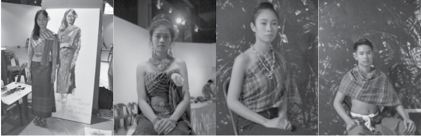
ภาพประกอบ 1 : ลักษณะการแต่งกายในชุดการแสดง ที่สื่อถึงความเป็นอัตลักษณ์อีสาน ที่มา : รณภพ เตชะวงศ์, 2558