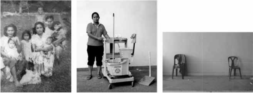
ภาพประกอบ 3 : ตัวอย่างภาพถ่ายในอดีตและปัจจุบัน อาชีพ การแต่งกายที่แสดงให้เห็นสัญลักษณ์ที่มีความหมายทางสังคม และภาพวัตถุที่แสดงความหมายเชิงมายาคติ