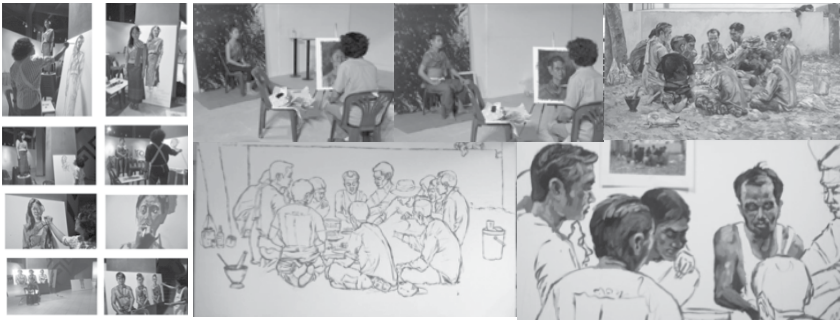
ภาพประกอบ 2 : ตัวอย่างขั้นตอนการเขียนรูปจากคนจริงและจากภาพถ่าย