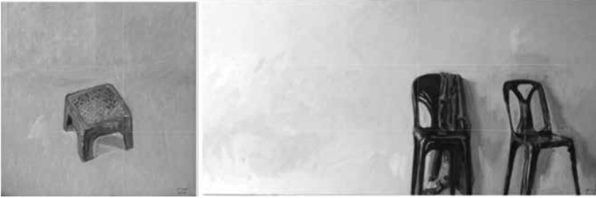
ภาพประกอบ 11 : ผลงานชิ้นที่ 11 เก้าอี้พลาสติกสีน้ำเงิน 1 และ 2 เทคนิค สีน้ำมันบนผ้าใบ ขนาด 60 x 80 ซม. และ 80 x 200 ซม.

เกี่ยวข้องกับหน่วยงานราชการ อาชีพแม่บ้านนั้นนิยมทำเป็นอาชีพเสริมและหลักของ ผู้หญิงวัยกลางคนที่มีการศึกษาไม่สูงนัก อาจเป็นภาพสะท้อนอันหนึ่งถึงให้เห็นถึง ทัศนคติหรือค่านิยมต่ออาชีพของคนอีสานส่วนหนึ่ง