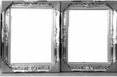
กรอบรูปสำเร็จรูปหลายหลยส์ ราคาถูก