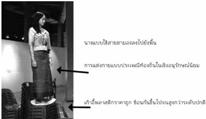
ภาพประกอบ 12 : การจัดทำทางและตำแหน่งของนางแบบ

พลาสติกฉูดฉาดทำให้รู้สึกถึงความด้อยค่าในเรื่องรสนิยม และเป็นสินค้าที่ผลิตซ้ำในเชิงอุตสาหกรรมเป็นจำนวนมาก ยิ่งสะท้อนให้เห็นถึงความไม่มีคุณค่า ความไม่มีลักษณะพิเศษ และหากพบเจอเก้าอี้พลาสติกอยู่ในที่ที่มีเก้าอี้หรือโซฟาสำหรับบุคคลอีกระดับ ก็ยิ่งแสดงให้เห็นความมีคุณค่าหรือ แสดงความสำคัญของบุคคลที่นั่งบนเก้าอี้ตัวนั้นๆ ได้เป็นอย่างดี เป็นคำถามว่า เรานั่งเก้าอี้แบบใด และใครเป็นผู้ใช้เก้าอี้พลาสติกสีฉูดฉาดแบบนี้