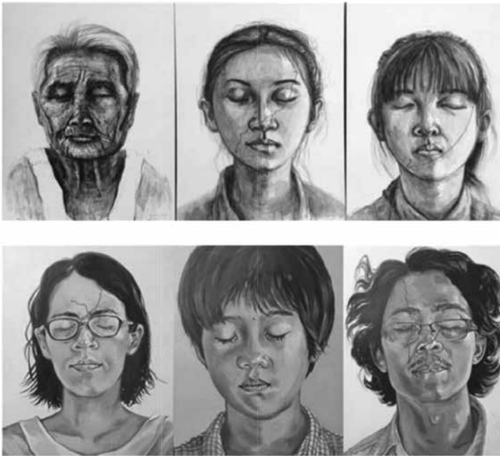
ภาพประกอบ 4 : ผลงานชิ้นที่ 1 และ 2 ชื่อผลงาน Map of life หมายเลข 1 และหมายเลข 2 เทคนิค สีน้ำมันบนผ้าใบ ขนาด ชิ้นละ 60 x 80 ซม.