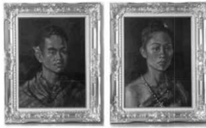
ภาพวาดบุคคลแต่งกายตามแบบประเพณี ท้องถิ่นในเชิงอนุรักษ์นิยม