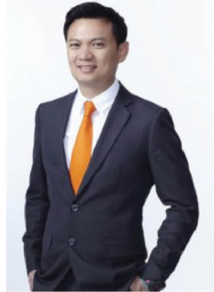
โดย ศาสตราจารย์ ดร.สุทธวีร์ สุวรรณสวัสดิ์