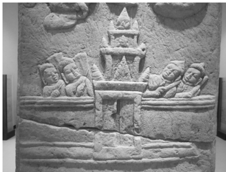
ภาพที่ 6 เสมาสลักภาพพุทธประวัติตอน โปรดพระนางพิมพายโสธรา (รายละเอียดส่วนล่าง) จากเมืองฟ้าแดดสงยาง อำเภอกมลาไสย จังหวัดกาฬสินธุ์ ปัจจุบันจัดแสดงในพิพิธภัณฑสถานแห่งชาติขอนแก่น