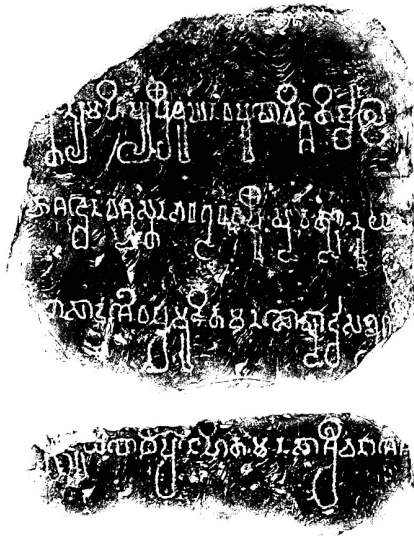
ภาพที่ 2 จารึกบ่อีกา ด้านที่ 1 (กรมศิลปากร, 2529, ค. : 23-29)