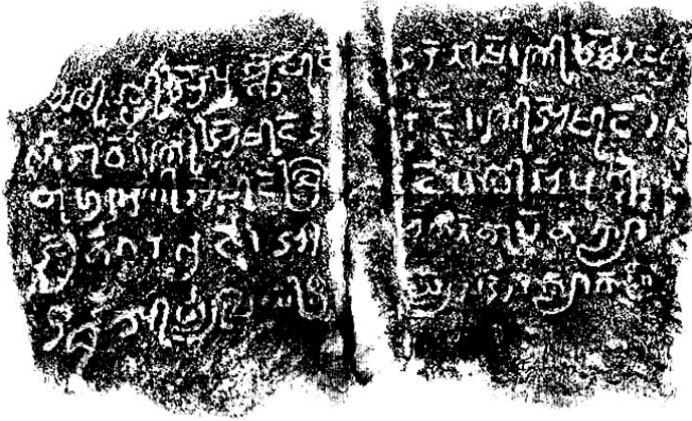
ภาพที่ 1 จารึกใบเสมาวัดโนนศิลา 1 (กรมศิลปากร, 2529, ก. : 67-72)