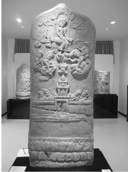
ภาพที่ 5 เสมาสลักภาพพุทธประวัติตอน โปรดพระนางพิมพายโสธรา จากเมืองฟ้าแดดสงยาง อำเภอกมลาไสย จังหวัดกาฬสินธุ์ ปัจจุบันจัดแสดงในพิพิธภัณฑสถานแห่งชาติขอนแก่น