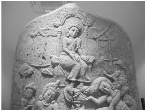
ภาพที่ 4 เสมาสลักภาพพุทธประวัติตอน โปรดพระนางพิมพายโสธรา (รายละเอียดส่วนบน) จากเมืองฟ้าแดดสงยาง อำเภอกมลาไสย จังหวัดกาฬสินธุ์ ปัจจุบันจัดแสดงในพิพิธภัณฑสถานแห่งชาติขอนแก่น