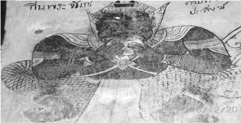
ภาพประกอบที่ 2 ฐูปแต่มราชูอมจันทร สิมวัดสนวนวาริพัฒนาราม ต.หัวหนอง อ.บ้านไผ่ จ.ขอนแก่น

ฐูปแต่มราชูอมจันทร เป็นเรื่องตำนานเทพในศาสนาพราหมณ์-ฮินดู ซึ่งตามคติของพราหมณ์ถือว่าพระราหู นับเป็นเทพองค์ที่ 8 ของเทวดานพเคราะห์ ตามตำนานบอกว่า พระอิศวรได้สร้างพระราหูขึ้น โดยใช้หัวผีโขมด 12 หัว ครั้งหนึ่งพระราหูได้ปลอมตัวเข้าไปในเทพชุมนุมเพื่อจะได้กินน้ำอมฤต พระจันทรและอาทิตย์พบเข้าจึงไปแจ้งแก่พระวิษณุ พระวิษณุจึงขว้างจักรออกไปถูกกายของพระราหูจนขาดไปครึ่งตัว แต่เนื่องจากได้ดื่มน้ำอมฤตแล้วจึงไม่ตาย พระราหูโกรธพระจันทรและพระอาทิตย์มากที่นำความไปบอกพระวิษณุจนทำให้ตนต้องถูกลงโทษ จึงหาโอกาสคอยจับพระอาทิตย์และพระจันทรเข้าไปในปากหรือที่เรียกว่าอม เพื่อเป็นการแก้แค้นอยู่เนืองๆ