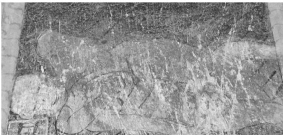
ภาพประกอบที่ 5 สูปแต้มเชิงสังวาส วัดบ้านลาน ต.บ้านลาน อ.บ้านไผ่ จ.ขอนแก่น

สูปแต้มเชิงสังวาส สันนิษฐานว่าอาจได้รับอิทธิพลจากลัทธิตันตระ ซึ่งเป็นลัทธิหนึ่งที่เกิดขึ้นต่อเนื่องจากนิกายศักติและภักตีในศาสนาพราหมณ์-ฮินดู คำว่า ตันตระ หมายถึง ปัญญาที่แผ่ไปเพื่อป้องกันอันตราย ตันตระเป็นหมวดคัมภีร์หนึ่งที่มีจุดมุ่งหมายยกย่องเชิดชูพระศิวะกับพระนางอูมาเทวี มีรูปแบบในการแสดงออกถึงความจงรักภักดีอย่างสูงสุด โดยรูปปั้นของการอยู่ร่วมกันเป็นคู่ อันมีเรื่องของกามารมณ์เข้ามาเกี่ยวข้อง และเน้นการยอมรับนับถือในรูปแบบพิธีกรรมที่ปราศจากเหตุผล (สุมาลี มหณรงค์ชัย ,2546) รูปแบบการนำเสนอดังกล่าวเป็นที่ถูกจริตของปุถุชนทั่วไป จึงถูกนำมาประยุกต์เสนอในรูปแบบต่างๆ