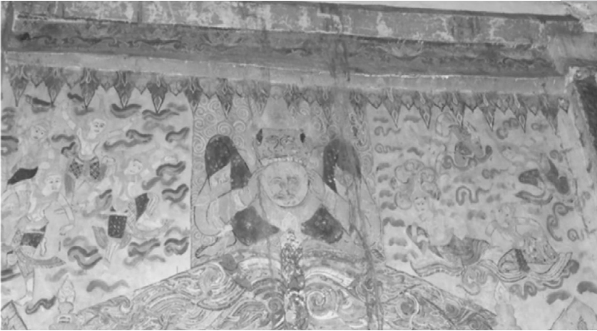
ภาพประกอบที่ 3 ฐูปแต้มราหูอมจันทร์ สิมวัดสระบัวแก้ว บ.หนองเม็ก ต.วังคูณ อ.หนองสองห้อง

ฐูปแต้มเรื่องพระлік-พระลाम หรือเรื่องรามเกียรติ์ เป็นเรื่องที่ปรากฏตามตำนานเทพในศาสนาพราหมณ์-ฮินดู โดยมีความเชื่อว่าพระรามเป็นภาคอวตารหนึ่งของพระวิษณุ(พระนารายณ์) การอวตารครั้งนี้มีวัตถุประสงค์เพื่อกำจัดทศกัณฐ์หรือท้าวราพณ์ โดยพระวิษณุอวตารลงมาเป็นโอรสองค์โตของกษัตริย์แห่งอโยธยา ทรงพระนามว่า พระราม มีพระอนุชาต่างมารดา คือ พระภรต พระลักษมณ์ และพระศัตรูด เรื่องราวดำเนินไปโดยเป็นการสงครามระหว่างเทพและอสูร สุดท้ายแล้วฝ่ายเทพก็เป็นฝ่ายชนะ มีตัวละครที่เป็นเทพสัตว์ในเรื่องนี้หลายตัว เทพสัตว์ที่มักปรากฏในภาพเขียนเสมอ คือ หนุมาน (สมคมแดง สมปวงพร,2537)