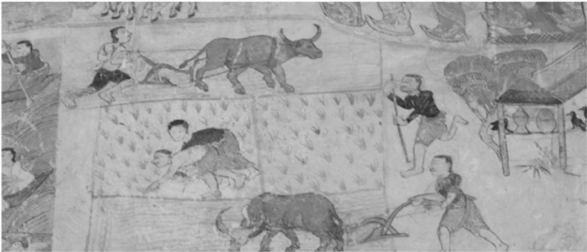
ภาพประกอบที่ 6 รูปแต้มวิถีชีวิตชาวอีสาน สิมวัดโพธาราม บ.ดงบัง ต.ดงบัง อ.นาइन

จะเห็นได้ว่าเรื่องราวหุอมจันทร์เป็นความเชื่อกันแพร่หลายในชุมชนท้องถิ่น โดยชาวบ้านมักจะตีเกราะเคาะกะลาไ้ร่าหุเพื่อให้ร่าหุคายพระจันทร์และพระอาทิตย์ ให้เป็นอิสระ ชุมชนบางแห่งมีการเคาะยุงฉางเพื่อเป็นเคล็ดว่าผลผลิตข้าวปีนี้จะดี ส่วนเรื่องพระลัก-พระรามก็เป็นวรรณกรรมที่คนส่วนใหญ่รู้จักกันอยู่แล้วเช่นเดียวกับวรรณกรรมอื่นๆ ที่ไม่ได้มีที่มาจากพระไตรปิฎกโดยตรง เมื่อเห็นว่าเป็นเรื่องที่แพร่หลายอยู่แล้วในท้องถิ่นก็ต้องการนำเสนอในวัดด้วย เนื่องจากวัดเป็นแหล่งเรียนรู้ของชุมชนในอดีต การวาดรูปแต้มในสิมอีสานจึงมีวัตถุประสงค์เพื่อการเรียนรู้ด้วย โดยนำเอาเรื่องราวในพระพุทธศาสนานำเสนอพร้อมกับเรื่องราวนอกพุทธศาสนา รวมทั้งเรื่องวิถีชีวิตและประเพณีท้องถิ่นด้วย อนึ่ง แม้เรื่องเพศศึกษาก็มีนำเสนอเพื่อสอดแทรกให้เรียนรู้กันในวัดได้ เพราะการเรียนรู้ในวัดก็เลสน่ากำเริบน้อยกว่าเรียนรู้เรื่องดังกล่าวนอกวัด