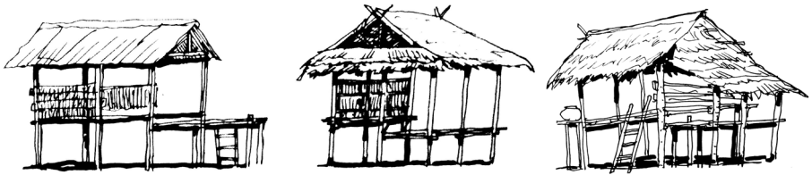
เถียงนายกพื้นสูงจากดิน ๒ ระดับ