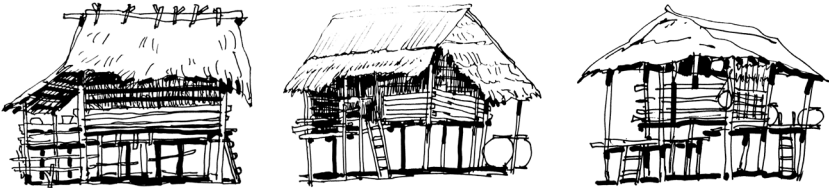
เถียงนายกพื้นสูงจากดินหลายระดับ

๔) เถียงนายกพื้นสูงจากดินหลายระดับ เป็นเถียงนาที่มีการแบ่งพื้นที่เพื่อใช้ประโยชน์มากขึ้น โดยการใช้ระดับพื้นเป็นตัวแบ่งแยกการใช้งาน เช่น เป็นพื้นที่พักจากบันได เป็นพื้นที่ทำครัว เป็นพื้นที่ใช้นั่ง และนอน เป็นต้น