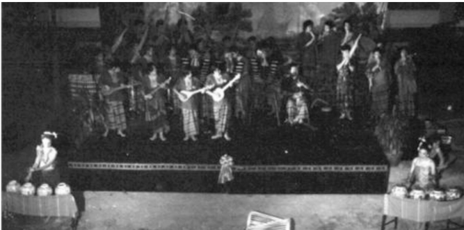
ภาพประกอบที่ 2 วงโปงลางศิลป์อีสานยุคก่อตั้ง

ในช่วง พ.ศ.2544-2548 วงโปงลางศิลป์อีสาน ก่อตั้งด้วยงบประมาณของสโมสรนิสิตคณะศิลปกรรมศาสตร์ในปี พ.ศ.2546 มีการเผยแพร่ศิลปวัฒนธรรมอีสานจากโครงการศิลปวัฒนธรรมสัญจรใน 3 พื้นที่ คือ บ้านป่าแดด ตำบลป่าแดด อำเภอแม่สววย จังหวัดเชียงราย จังหวัดเชียงใหม่ และจังหวัดนครสวรรค์ และมีการแสดงดนตรีโปงลางในกิจกรรมของคณะ มหาวิทยาลัย และชุมชนใกล้เคียง แต่ยังไม่มีการเผยแพร่สู่สาธารณะมากนัก โดยเป็นการรวมตัวกันระหว่างนิสิต คณาจารย์ ผู้สนใจ ร่วมเล่นและบริหารจัดการในเชิงกิจกรรมเสริมหลักสูตรของมหาวิทยาลัย