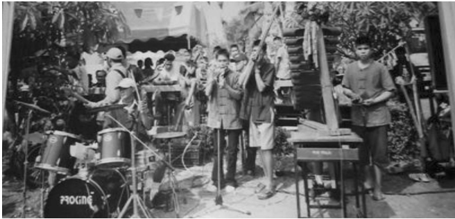
ภาพประกอบที่ 4 วงโปงลางสี่ทันทยุคก่อตั้ง

วิทยา ตำบลโคกคอน อำเภอนาคู จังหวัดนครราชสีมา เป็นกิจกรรมเสริมหลักสูตรของโรงเรียน ในปี พ.ศ.2546 ได้รับความร่วมมือจากศิษย์เก่าจัดทำผ้าป่าเพื่อสมทบทุนซื้อเครื่องดนตรีที่บ้าน ในช่วงแรกได้เชิญวิทยากรท้องถิ่นที่มีความรู้มาฝึกสอนนักเรียนและฝึกซ้อมจากสื่อวีดิทัศน์ จึงสามารถแสดงดนตรีโปงลางในกิจกรรมของโรงเรียนและให้บริการชุมชน แต่ยังไม่มีการเผยแพร่สู่สาธารณะมากนัก โดยมีนักเรียนทุกระดับชั้น ร่วมเล่นและบริหารจัดการในเชิงกิจกรรมเสริมหลักสูตรของโรงเรียน