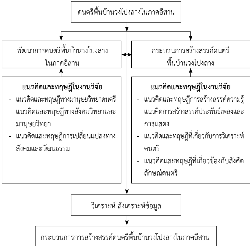
ภาพประกอบที่ 1 กรอบแนวคิดในการวิจัย