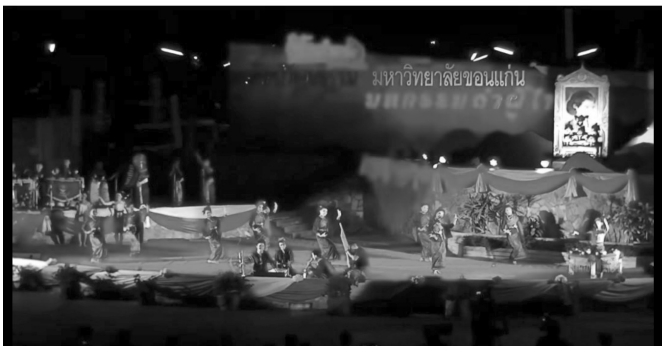
ภาพประกอบที่ 5 วงโปงลางสี่ทันทยุคปัจจุบัน