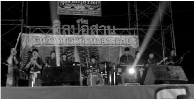
ภาพประกอบที่ 3 วงโปงลางศิลป์อีสานยุคปัจจุบัน