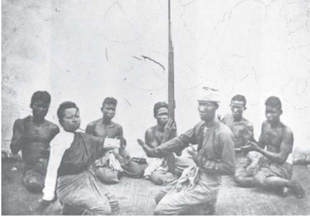
ภาพประกอบ 2 หมอลำหญิงกำลังนั่งคุกเข่ารำลำ สันนิษฐานว่าเป็นการแอ้วลาว

ก็ค่อยๆพัฒนามาจนเจริญรุ่งเรืองอย่างยิ่งในปัจจุบัน โดยเฉพาะในภูมิภาคอีสานของไทย ซึ่งมีพัฒนาการอย่างน่าสนใจมาเป็นลำดับ