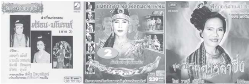
ภาพประกอบ 3 พัฒนาการของหมอลำ หมอลำเรื่องตอกลอน หมอลำเพลิน หมอลำชิง