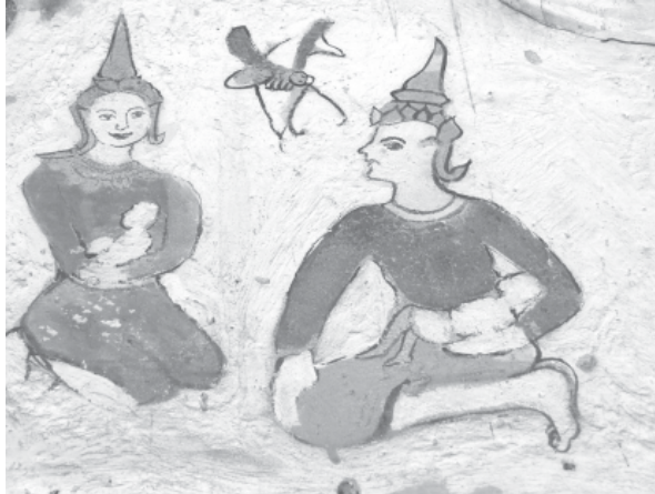
ภาพประกอบที่ 7 การบูรณะภาพจิตรกรรมฝาผนังวัดท่าเรือ จังหวัดบุรีรัมย์

กรณีวัดตาลเรือ สิมเก่าวัดตาลเรืออยู่ในสภาพทรุดโทรมมากโดยเฉพาะช่วงหลังคาและโครงสร้างอาคารและไม้ ในปี พ.ศ. 2527 วัดและชุมชนได้สร้างสิมใหม่แบบภาคกลางครอบสิมเก่าเอาไว้ ซึ่งระยะห่างระหว่างผนังสิมเก่าและผนังสิมใหม่ประมาณ 70 เซนติเมตร เนื่องจากมีการรับความชื้นของอาคาร (Penetrating Damp) ทำให้น้ำใต้ดินที่ซึมเข้าในตัวอาคารเก่าประกอปกกับสิมไม่ค่อยมีการใช้งานและไม่มีการเปิดระบายอากาศทำให้บรรยากาศข้างในสิมมีกลิ่นอับและความชื้นมากส่งผลทำจิตรกรรมฝาผนังหลุดลอกออกจากชั้นรองรับภาพ (support)