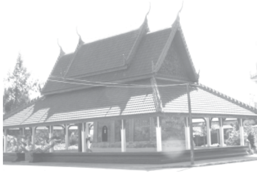
ภาพประกอบที่ 1 สิมที่ปรากฏจิตรกรรมฝาผนังวัดมณีนิมิตวิทยาการ จังหวัดขอนแก่น