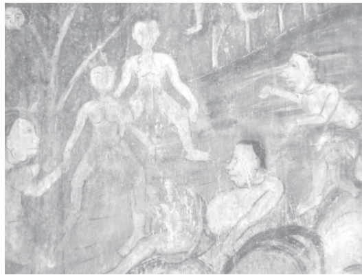
ภาพประกอบที่ 8 การขูดภาพจิตรกรรมฝาผนังในตอนที่มีการแสดงอวัยวะเพศของวัดมัชฌิมนิเวศวิหาร จังหวัดขอนแก่น

และผู้ชายซึ่งบางภาพมีส่วนสำคัญอันเป็นเนื้อหาในวรรณกรรมเช่น ภาพเหล่าเมียพรหมณ์เปิดผ้าถุงใส่นางอมิตดาผู้เป็นภรรยาซุกซก ภาพซุกซกร่วมรักกับนางอมิตดาในวรรณกรรมเรื่องเวสสันดรชาดก ภาพต้นนารีผลในเรื่องสินไช ที่ช่างเขียนสร้างภาพต้นนารีผลที่แสดงให้เห็นอวัยวะเพศของนางนารีผล เป็นต้น ภาพเหล่านี้มักจะถูกขูดสีกออกซึ่งทำให้ภาพจิตรกรรมเสียหายและภาพไม่สมบูรณ์