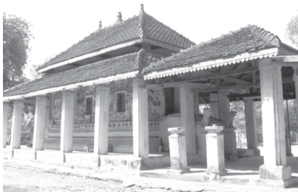
ภาพประกอบที่ 2 สิมที่ปรากฏจิตรกรรมฝาผนังวัดท่าเรือ จังหวัดบุรีรัมย์

จิตรกรรมฝาผนังปรากฏทั้งผนังสิมด้านนอกและผนังสิมด้านใน ผนังสิม ด้านนอกทิศเหนือ ทิศตะวันออกและทิศใต้ปรากฏวรรณกรรมเรื่องเวสสันดรชาดก (ผนังด้านนอกบนสุดของทิศใต้ปรากฏวรรณกรรมพื้นบ้านเรื่องสินไช) ผนังสิมทิศตะวันตกปรากฏวรรณกรรมเรื่องพุทธประวัติ ส่วนผนังสิมด้านในทิศเหนือและทิศใต้ปรากฏภาพพุทธสาวก ผนังทิศตะวันออกเขียนภาพพระมาลัยและทิศตะวันตกปรากฏวรรณกรรมเรื่องพุทธประวัติตอนเสด็จปรินิพพาน