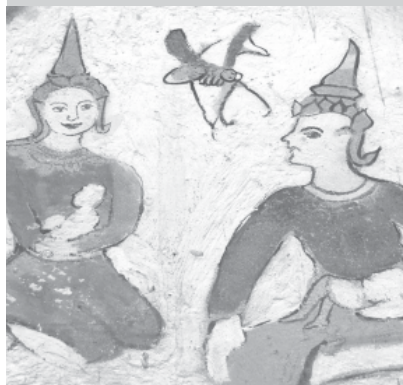
ภาพจิตรกรรมฝาผนังวัดท่าเรือ จังหวัดบุรีรัมย์