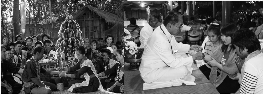
ภาพประกอบที่ 1 ภาพแสดงการผูกเสี่ยว ในเทศกาลงานไหม จังหวัดขอนแก่น

ถึงทุกสิ่งทุกอย่างที่แสดงออกถึงวิถีชีวิตมนุษย์ในสังคมของกลุ่มกลุ่มหนึ่งหรือสังคมใดสังคมหนึ่ง ซึ่งมนุษย์ได้สร้างระเบียบ กฎเกณฑ์วิธีในการปฏิบัติ รวมทั้งการจัดระเบียบ ตลอดจนระบบความเชื่อ ค่านิยม ความรู้และเทคโนโลยีต่างๆ โดยได้วิวัฒนาการสืบทอดกันมาอย่างมีแบบแผน