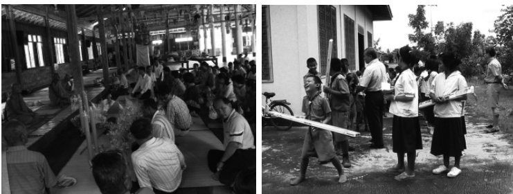
ภาพประกอบที่ 3 ภาพถวายเทียนพรรษา จังหวัดขอนแก่น

สามารถของผู้นำที่พัฒนาและสร้างระบบการติดต่อสัมพันธ์ที่ก่อให้เกิดความไว้วางใจโครงสร้างองค์กรมีขนาดกะทัดรัดแต่ครอบคลุมมีความรวดเร็วในการตอบสนองต่อข่าวสารและการเปลี่ยนแปลงต่างๆผู้บริหารที่มีความสามารถ มักมีประสบการณ์ผ่านงานในองค์กรที่มีวัฒนธรรมอย่างนี้มาก่อนเสมอ ซึ่งวัฒนธรรมองค์กรที่กล่าวมาในข้างต้นเป็นวัฒนธรรมที่แบ่งตามพื้นฐานของตัวแปรที่แตกต่างกันไปและผู้เขียนจะกล่าวถึงลักษณะของวัฒนธรรมองค์กรลักษณะสร้างสรรค์ตามแนวคิดของ Cooke and Lafferty, 1989 (อ้างถึงในจารุวรรณ ประดา, 2545)