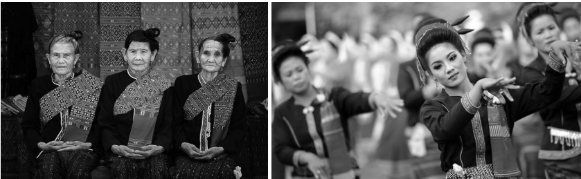
ภาพประกอบที่ 6 ภาพแสดงชาติพันธุ์ต่างๆ ใน จังหวัดขอนแก่น

6. อำเภอในพื้นที่วิจัยมีการจำแนกชาติพันธุ์ในชุมชนของท่าน ในระดับมากที่สุด กลุ่มชนที่มีลักษณะรูปร่างเหมือนหรือคล้ายคลึงกันมีวัฒนธรรมขนบธรรมเนียมประเพณีและภาษากลุ่มคนไทยกลุ่มคนจีน กลุ่มคนพม่า กลุ่มคนลาว กลุ่มคนเขมร กลุ่มคนอินเดีย เป็นต้น จะเห็นได้ว่าการจำแนกหรือแบ่งแยกชาติพันธุ์สามารถทำได้โดยการเปรียบเทียบด้านเชื้อชาติ ได้แก่ รูปลักษณ์หรือลักษณะทางชีวภาพ เช่น สีผิว สีผม สีนัยน์ตา และด้านสัญชาติ คือ การเป็นสมาชิกประเทศใดประเทศหนึ่งขนบธรรมเนียมและวัฒนธรรมเป็นตัวจำแนกและกำหนดที่สำคัญกว่า ยกตัวอย่างเช่น กลุ่มคนจีนหรือกลุ่มคนอินเดีย มีสำนึกในความเป็นคนจีนหรือความเป็นคนอินเดียโดยคนทั้ง 3 กลุ่มนี้ต่างรวมกันโดยเชื้อชาติ สัญชาติ และชาติพันธุ์ต่างๆ ที่มีภาษาพูดหลายภาษา คนจีนที่พูดภาษาไทหล่า กวางตุ้ง และฮกเกี้ยน ต่างก็เรียกตัวเองว่าเป็นคนจีน คนอินเดียที่พูดภาษาฮินดี เบงกาลี และทมิฬ ต่างก็เรียกตัวเองว่าเป็นคนอินเดีย ดังที่พจนานุกรมศัพท์สังคมวิทยาให้ความหมายของชาติพันธุ์ไว้ว่า หมายถึง “กลุ่มที่มีพันธะเกี่ยวข้องกัน และที่แสดงเอกลักษณ์ออกมา โดยการผูกพันลักษณะการของเชื้อชาติและสัญชาติเข้าด้วยกัน ทั้งนี้ยังเชื่อกันว่า กลุ่มชาติพันธุ์สืบเชื้อสายมาจากบรรพบุรุษกลุ่มเดียวกันซึ่งบรรพบุรุษในที่นี้หมายรวมถึงบรรพบุรุษทางสายเลือด และบรรพบุรุษทางวัฒนธรรมด้วย โดยธรรมชาติของผู้ที่อยู่ในกลุ่มชาติพันธุ์เดียวกันจะมีความรู้สึกผูกพันทางสายเลือด