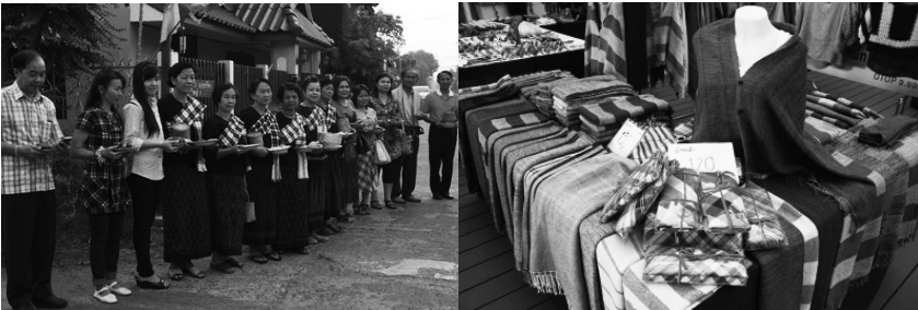
ภาพประกอบที่ 7 ภาพแสดงการใช้ผ้าไหมและผ้าขามมาที่ผลิตขึ้น จังหวัดขอนแก่น

7. อำเภอนิพพานที่วิจัยมีการรณรงค์ให้ใส่ชุดเสื้อผ้าที่ผลิตในท้องถิ่นในระดับมากที่สุดอีกทั้งยังพบว่า การถ่ายทอดงานฝีมือภูมิปัญญาท้องถิ่นจากคนรุ่นเก่าถึงคนรุ่นใหม่มีน้อยมากทำให้ลดสายการทอผ้าพื้นเมืองหายบลงหรืออาจเรียกได้ว่าแหล่งผ้าที่เกิดจากภูมิปัญญาชาวบ้านใกล้ตายลงแล้วหากไม่มีการร่วมส่งเสริมให้คนไทยใช้ผ้าไทยและช่วยเหลือชาวบ้านภูมิปัญญาท้องถิ่นดีๆ ต้องสูญหายไปอย่างแน่นอน