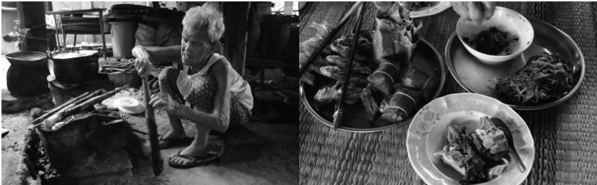
ภาพประกอบที่ 8 ภาพแสดงการรับประทานอาหารที่ได้จากวัตถุดิบใน จังหวัดขอนแก่น

ส่วนใหญ่แล้วจะออกรสชาติไปทางเผ็ด เค็ม และเปรี้ยว เครื่องปรุงอาหารอีสานที่สำคัญและแทบขาดไม่ได้เลย คือ ปลา ร้า ซึ่งที่เกิดจากภูมิปัญญาด้านการถนอมอาหารของบรรพบุรุษของชาวอีสาน ถ้าจะกล่าวถึงชาวอีสานทุกครัวเรือนต้องมีปลา ร้าไว้ประจำครัวก็คงไม่ผิดนัก ปลา ร้าใช้เป็นส่วนประกอบหลักของอาหารได้ทุกประเภท เหมือนกับที่ชาวไทยภาคกลางใช้น้ำปลา