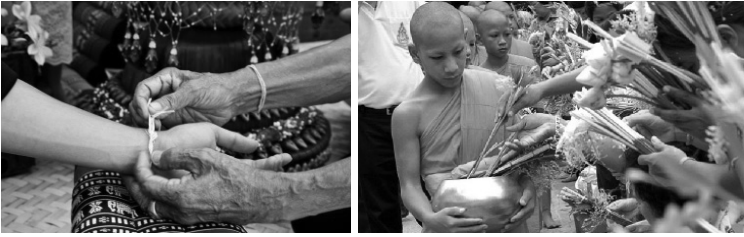
ภาพประกอบที่ 2 ภาพแสดงการบายศรีสู่ขวัญและการตักบาตรดอกไม้

3. อำเภอบ้านฝางมีการปลูกจิตสำนึก ในระดับมากที่สุดในรูปแบบวัฒนธรรมของตนเอง รูปแบบวัฒนธรรมที่ผู้นำจะมีกลุ่มผู้บริหารที่สามารถเป็นที่ปรึกษาหรือเป็นผู้สนองรับหรือนำการตัดสินใจ นโยบายแนวทาง และ แผนงานไปปฏิบัติให้บรรลุผลความสำเร็จของทีมบริหาร เกิดจากความ