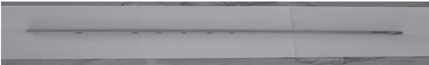
ภาพประกอบที่ 2 ปี่ลื้อขนาดกลาง ขนาด 13.9 นิ้ว