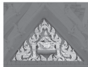
ทิศ:เหนือ : พระธาตุ (กำแพงสุโขทัย)