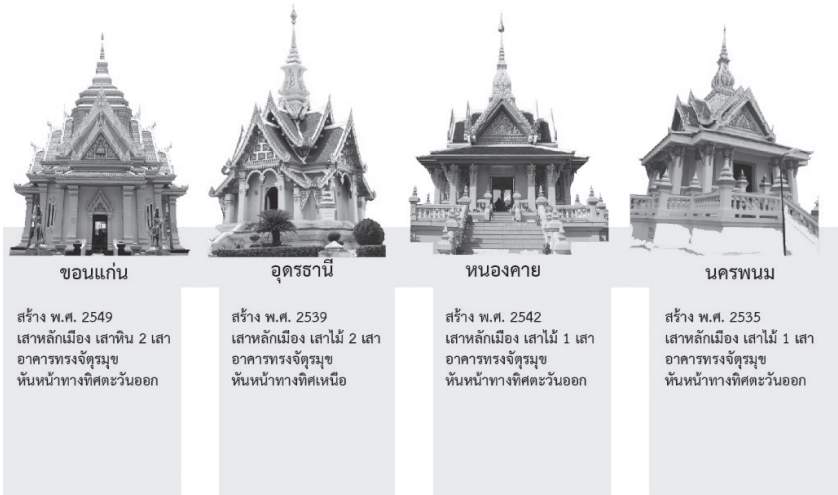
ภาพประกอบที่ 3 รูปแบบศาลหลักเมืองทั้ง 4 แห่ง