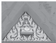
ทิศ:ใต้ : พระธาตุพนม