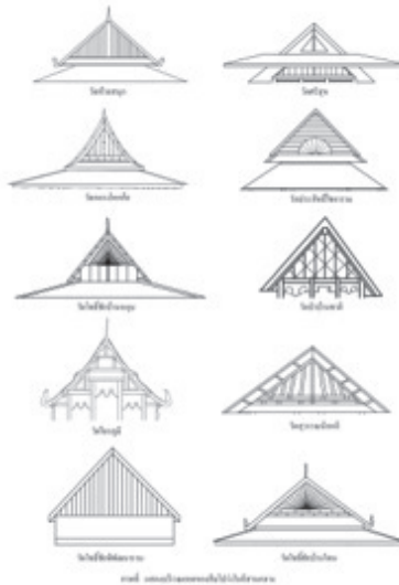
ภาพประกอบที่ 3 ส่วนตกแต่งสัมิโปร่งในอีสานกลาง