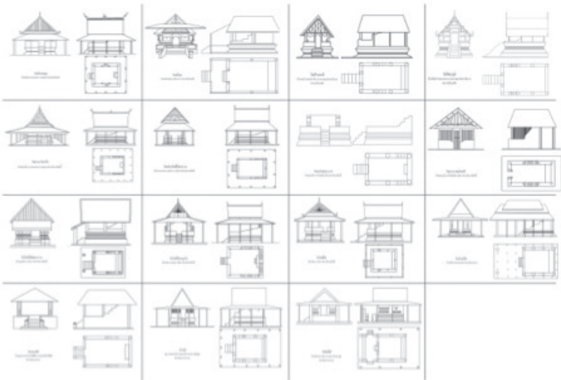
ภาพประกอบที่ 2 ภาพด้านหน้า ด้านข้าง และแปลนสิม ในอีสานกลาง

มีแปลนรูป 4 เหลี่ยมผืนผ้าขนาดไม่เกิน 3 ช่วงเสา พื้นที่ภายในใช้สอยได้ไม่เกิน 20 ตารางเมตร ไม่นิยมทำผนังทึบมักก่ออิฐสูงเป็นชั้นบันไดไปทางค์พระประธานเฉพาะด้านหลังพระประธาน จะก่อผนังปิดทึบเพียงด้านเดียว ส่วนบริเวณที่อาสนะสงฆ์จะก่อขึ้นมาล้อมรอบเพียงไม่เกิน 50 เซนติเมตร ด้านทางเข้าจะเป็นช่องแทนประตูปิดเปิด ตามภาพประกอบดังนี้