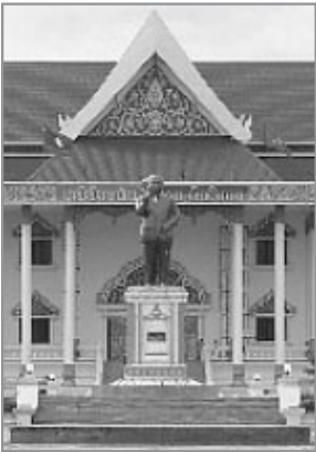
ภาพประกอบที่ 6 ภาพอนุสาวรีย์ไกสอนพมวิหาน ที่พบทุกแขวงในประเทศลาว

ภาพชานา ทหาร และคนงานเท่านั้นเสมือนเป็นเครื่องเตือนใจว่า บัดนี้พุทธศาสนา และธุรกิจเอกชนได้หวนกลับคืนมาสู่สาธารณรัฐประชาธิปไตยประชาชนลาวอีกครั้งหนึ่ง ปัจจุบันแวดวงศิลปะลาวกำลังอยู่ในช่วงของการเปลี่ยนแปลง จากแนวคิดเชิงสังคมนิยมสังคมนิยม และภาพการต่อสู้อย่างวีรบุรุษเปลี่ยนไปเป็นภาพในเชิงพุทธศาสนานักธุรกิจ และการละเล่นในอดีต แม้จะยังมีอิทธิพลแนวคิดในเชิงสังคมนิยมสังคมนิยมปะปนอยู่ก็ตาม (พวงนิล คำป้งส์, 2544)