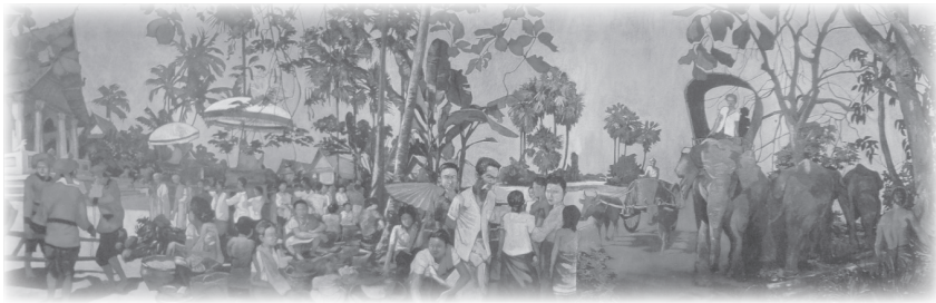
ภาพประกอบที่ 5 ภาพ Scenes de la vie villageoise. 1948-1951