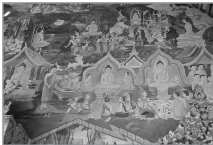
ภาพประกอบที่ 2 ภาพจิตรกรรมฝาผนังภายนอกสิม วัดเชียงม่วน แขวงหลวงพระบาง