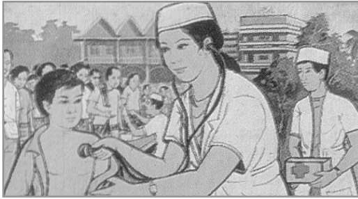
ภาพประกอบที่ 8 ภาพการให้บริการรักษาและฉีดวัคซีน