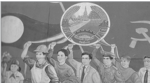
ภาพประกอบที่ 7 ภาพคนงาน ชานา และทหาร องค์สาม ของระบอบสังคมนิยม แบบเก่ากับพระภิกษุและนักธุรกิจ ซึ่งเพิ่มเติมเข้ามาเมื่อไม่นานมานี้